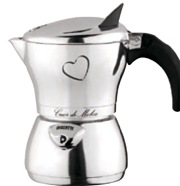
Cuor di Moka®